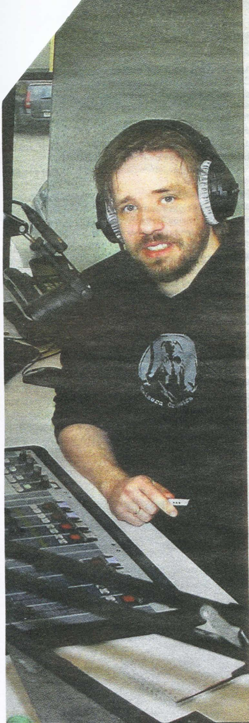
...tig Henning har vært med siden 1987, Jon-Mag-