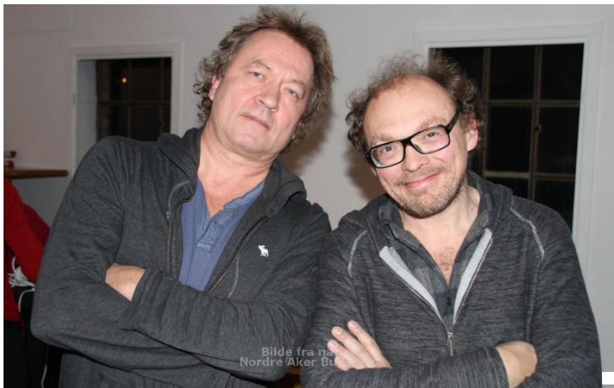
Nils Petter Molvær og Jens Christian Bugge Wesseltoft fra fjorårets intimkonsert ved Akerselva og ved Frysja Kunstsenter.

LES OGSÅ: Nå har byråden bestemt seg for hva som skal skje videre med Skar leir