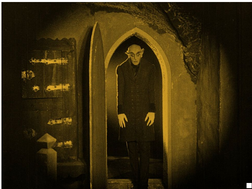
Skrekk og gru ved Akerselva - fredag 15. september.