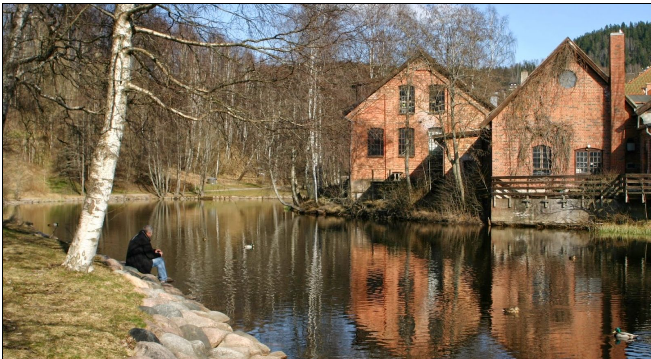
Frysja Kunstsenter ved Akerselva.

– Ta med varmt tøy, pledd, skjerf, egen stol og la gyset sige inn over deg med tåken fra Akerselva, inviterer Frysja-kunstnerne til utekino, og frister også med live musikk til filmen av ingen ringere enn Bugge Wesseltoft og Nils Petter Molvær!