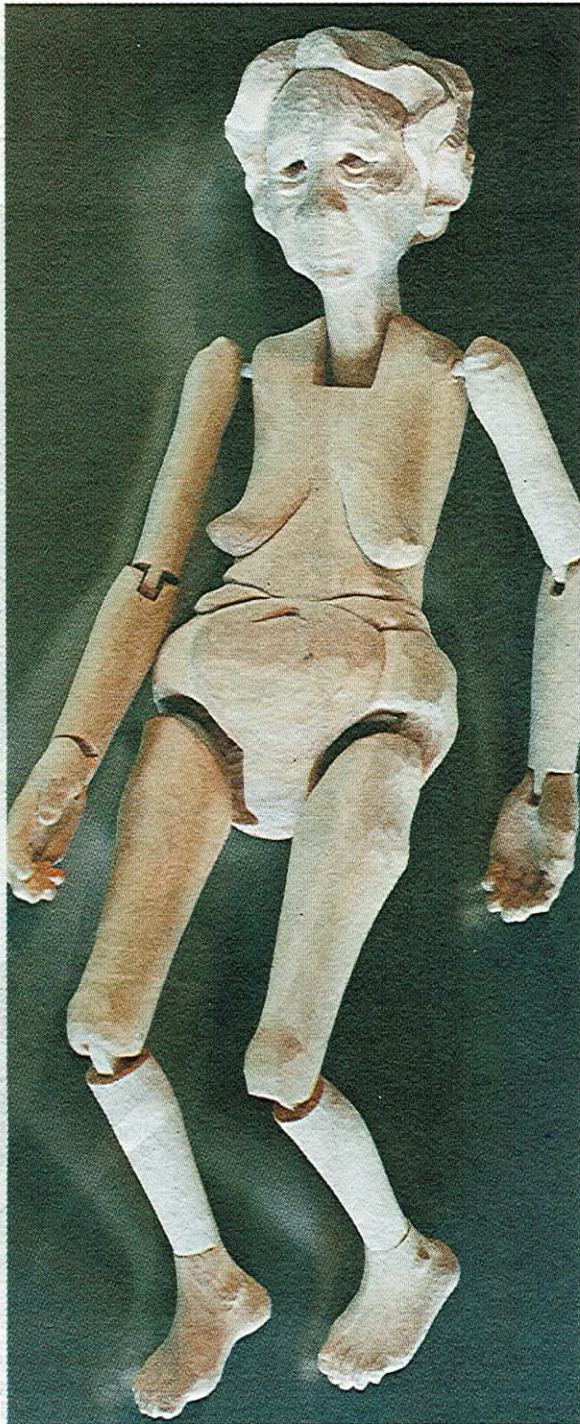
« Om bevegelse i trær »: Ragnhild Gjems syns at trær og menneskekropper har sammenfallende symbolsk verdi.