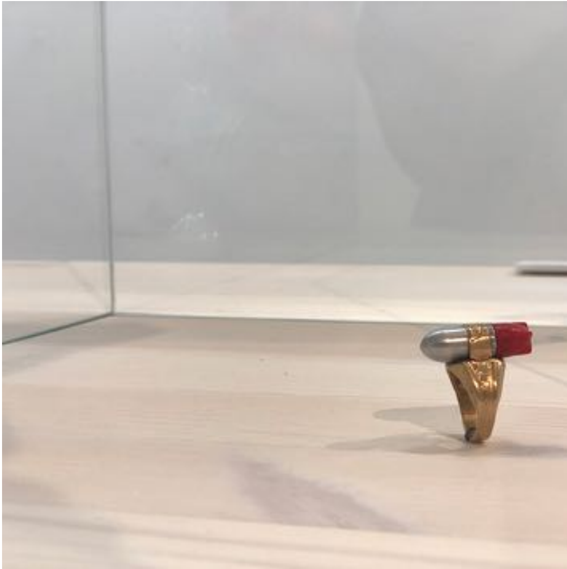
I annen etasje møter du «The lone ranger atomic bomb ring», 1947, produsert av Kix Company.

- For oss var det et poeng å fylle hele huset med smykker, som ellers ikke blir eksponert i de store utstillinger