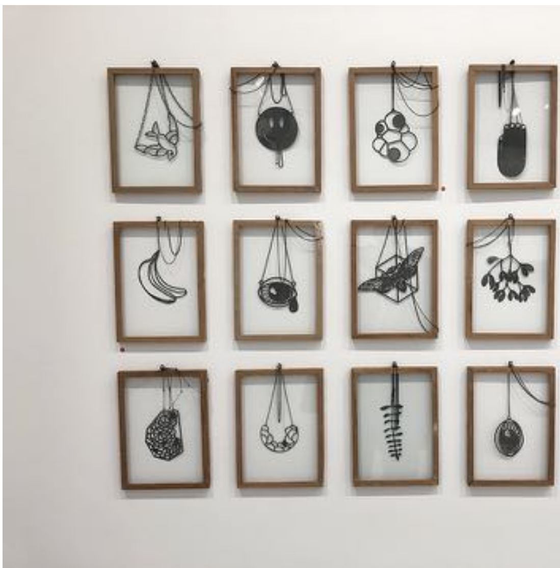
Overlyssalen i Kunstnerforbundet fyller hundre år i år. Her, montasjen "Places I've been, things I've seen, 2015–2018 av Carjenbrukt sink, oksidert sølv, found objects (rammer).

– Det er en variert utstilling med veldig mange verk fra ulike deler av verden. Vi håper utstillingen kan bidra kan være, sier Solbakken.